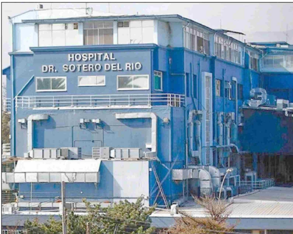
Hospital Sótero del Río en Puente Alto.