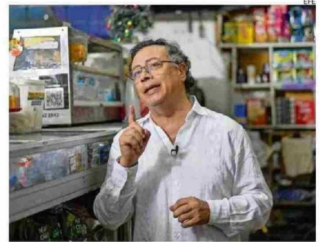
EL PRESIDENTE DE COLOMBIA, GUSTAVO PETRO.