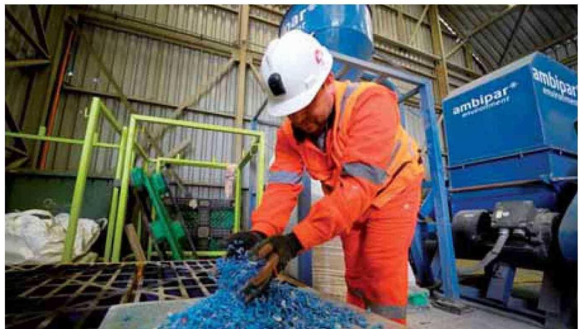
La división El Teniente, de Codelco, ha impulsado el reciclaje de residuos industriales no peligrosos, como la recuperación de chatarra y otras aleaciones metálicas.

La Política Nacional Minera establece como un objetivo central estratégico en materia ambiental impulsar un modelo de economía circular a través de la reutilización de residuos y el uso eficiente de recursos.