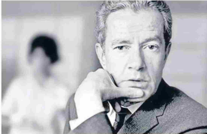
Rulfo falleció en 1986. Publicó poco más de 400 páginas.

Juan Rulfo, México: 1917-1986, es uno de los mayores autores de la lengua española y eso que sólo publicó un poco más de 400 páginas. Allí están la novela "Pedro Páramo", el volumen de cuentos "El llano en llamas" y una historia escrita para el cine, "El gallo de oro". La primera es una obra enorme, una de las cumbres literarias de la humanidad. Transcurre en un pueblo donde todos están muertos. Veamos el siguiente diálogo: "Siento como si alguien caminara sobre nosotros. Ya déjate de miedos... Haz por pensar en cosas agradables porque vamos a estar mucho tiempo enterrados" (56). Tremendas líneas, gran novela. Pero recomendarla como lectura veraniega es arriesgado (escribimos este comentario pensando en proponer algunas lecturas para este tiempo en que el sistema nos da un respiro y nos deja espacios para leer y pensar). Pero una obra tan compleja pareciera no ser la adecuada. Nos explicamos: está compuesta por una suma de historias relativamente cortas que se van entrelazando y que, para mayor dificultad, ocurren en tiempos distintos. Esta complejidad estructural responde a un imperativo de todo gran autor: innovar en el arte literario. Esa necesidad de innovación hace que este se encuentre en constante cambio. De ahí que se sucedan movimientos, tendencias, influencias, etc. Todo escritor mayor se sitúa en un punto que Octavio Paz de-