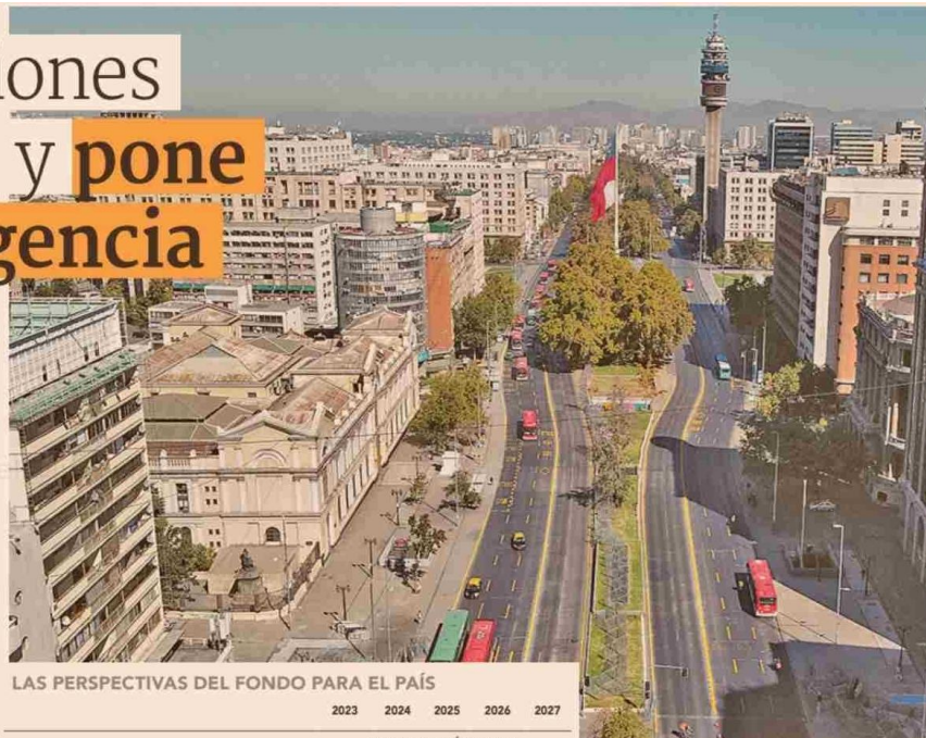
LAS PERSPECTIVAS DEL FONDO PARA EL PAÍS

"Las necesidades políticas son ahora principalmente de carácter estructural. Las prioridades incluyen impulsar el crecimiento y el empleo a mediano plazo, reforzar las reservas fiscales, del sector financiero e internacionales, especialmente en el contexto de un entorno mundial difícil, y seguir reduciendo la desigualdad".