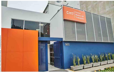
En 2023, la red privada de salud laboral desembarcó en Lima, Perú, con su primera sucursal.

Centro Médico del Trabajador, que recientemente obtuvo la certificación ISO 27.001 como garantía de la seguridad de la información y la integridad de los datos informáticos que manejan.