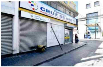
Varios locales tuvieron que recurrir a los generadores para mantenerse operativos.

CURICÓ. Una inesperada y extensa interrupción del suministro de energía eléctrica fue la que sufrieron millones de personas a lo largo del país, incluyendo quienes residen en la Región del Maule. En tal contexto, al igual que en otras ciudades de Chile, se presentaron una serie de inconvenientes producto de dicho escenario.