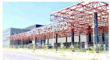
El nuevo Hospital de Curicó pasó la prueba tras el apagón: mantuvo sus servicios "con normalidad".

Recalcó Canteros que a pesar del aludido corte, se hicieron cirugías, "sin mayores dificultades", logrando mantener los servicios "con normalidad" dentro del aludido contexto. "Se tomaron decisiones y los planes de acción y estamos también en contacto con la red de salud de la región", acotó.