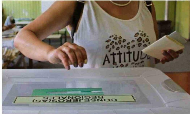
LAS ELECCIONES EN TODO EL PAÍS SE REALIZARÁN EL DOMINGO 24 DE OCTUBRE, CON VOTO OBLIGATORIO.