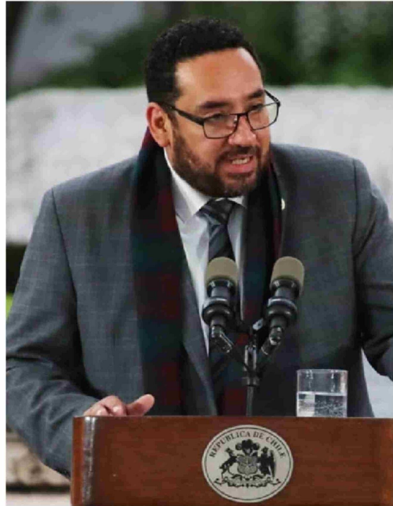
► Nicolás Cataldo (PC), ministro de Educación.

que le habla al país cuando vemos la cantidad de personas que están en deuda, que es más de un millón y medio. Vemos que además transversalmente hay una valoración a la conclusión de que esto no es una discusión de nicho político, que es una discusión de interés nacional y que va a impactar a personas mucho más allá de nuestro propio sector político.