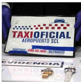
FALSAS IDENTIFICACIONES. — Red utilizaba carteles para simular estar reguladas.

El mecanismo para robarles: los imputados aprovechaban que a la salida del aeropuerto la mayoría de los turistas perdía la conexión a internet, y si