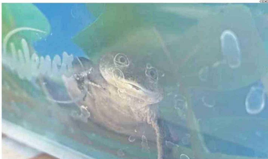
UNO DE LOS ESPECÍMENES LOGRADO EN EL PROCESO DE REPRODUCCIÓN EN CAUTIVERIO DE LA RANITA DEL LOA EN EL PARQUE METROPOLITANO.

Si bien, reconoció que el desafío mayor que tendrán por delante era devolverlas al hábitat, también planteó que es una instancia súper larga para cumplir con este objetivo, que podría ser mayor a dos años, e