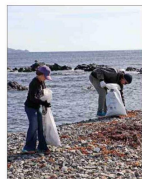
Más de 9 toneladas de basura fueron retiradas desde Chañaral de Acetum, en Atacama, caleta de interés turístico por ser uno de los principales puntos de avistamiento de ballenas del país. | C 10

Laguna de Aculeo presenta importante recuperación Luego de los sistemas frontales en la zona centro sur, las precipitaciones acumuladas han logrado revivir lagunas y embalses desaparecidos por la sequía. Entre ellas la laguna de Aculeo, en Paine, que presenta actualmente cerca de un 60% de su capacidad total. Ello ha provocado también la reaparición de las aves y otra fauna del sector. De todas formas, expertos advierten que, por su dependencia de las lluvias, podría volver a secarse. | C 11