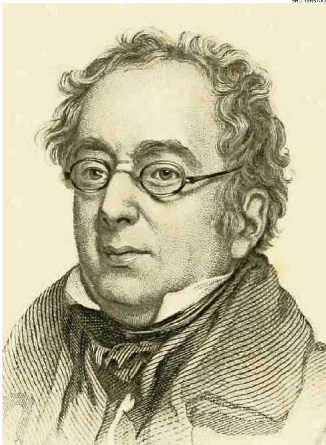
ISAAC DISRAELI PUBLICÓ “CURIOSIDADES DE LA LITERATURA” EN CUATRO TOMOS, ENTRE 1791 Y 1823.