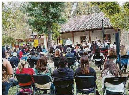
EXITOSO CONCIERTO DE LA ORQUESTA JUVENIL DE CALLE LARGA.

vergencia para actividades lúdicas y de aprendizaje, como charlas interactivas y actividades prácticas, diseñadas para involucrar a los asistentes en la exploración de la historia local.