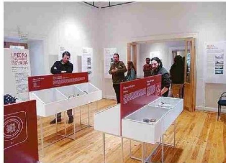
EXPOSICIÓN DE PERTENENCIAS DE PEDRO AGUIRRE CERDA.

"Es un espacio de esparcimiento también", afirma, destacando que la comunidad puede disfrutar de programas de con-