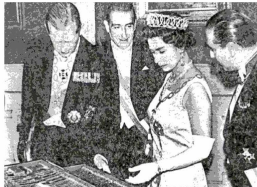
La reina Isabel II le otorgó el título de "sir". La monarca de Reino Unido visitó Chile en 1968, mientras él estaba como director de protocolo.

no tengo ni una arruga, y eso es porque ni me arrugo con las cosas que pasan en nuestro país. Tengo paciencia, pero insistencia al mismo tiempo, para poder hacer y servir. Ya me han dado bastante en el gusto, porque me han hecho cuantos honores que he podido ver en un ser vivo. Muy atípico en nuestro Chile que, lamentablemente, tiene muchas dosis de envidia en el ambiente. La envidia, aquí, es casi una profesión". —A las personas se les suele reconocer su aporte cuando ya están muertas. "Por eso los entierros son tremendos. Cada uno trata de hablar lo que se calló durante toda su vida. Yo, en cambio, lo estoy escuchando todo en vida y no creo que haya ninguna dificultad en que me pueda desaparecer fugazmente sin que pase nada mayormente, porque ya todo ha sido hecho y dicho". —Usted fue director de la Academia Diplomática "Andrés Bello". ¿Cómo debe ser un diplomático? "El diplomático puede tener muchos títulos, pero sobre todo debe tener una vocación