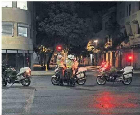
AYER SE LEVANTÓ EL TOQUE DE QUEDA PARA LAS 14 REGIONES.

de los activos de generación que no funcionaron o tuvieron fallas.