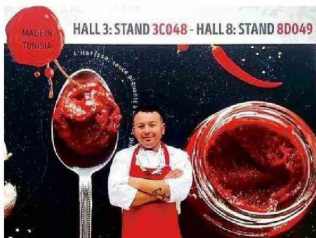
EL CHEF SANANTONINO COCINANDO EN ALEMANIA EN 2016.

Título: El chef que promueve lo mejor del mar chileno en el extranjero