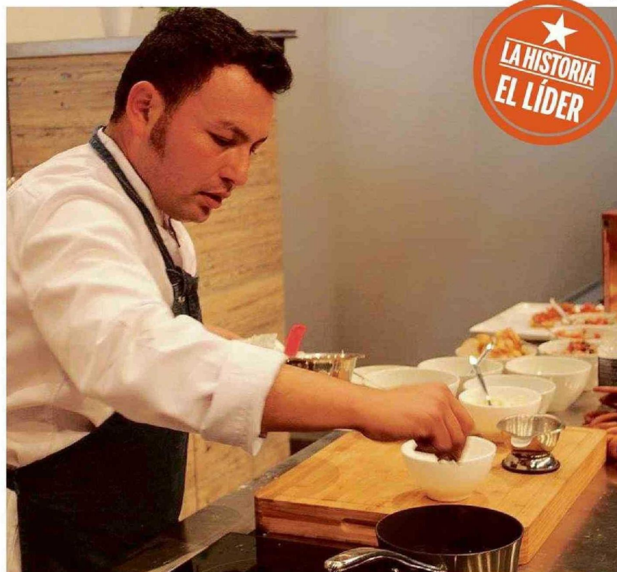
RECUERDO DE LA BECA EN EL INSTITUTE CULINARY DE NEW YORK AÑO 2009.