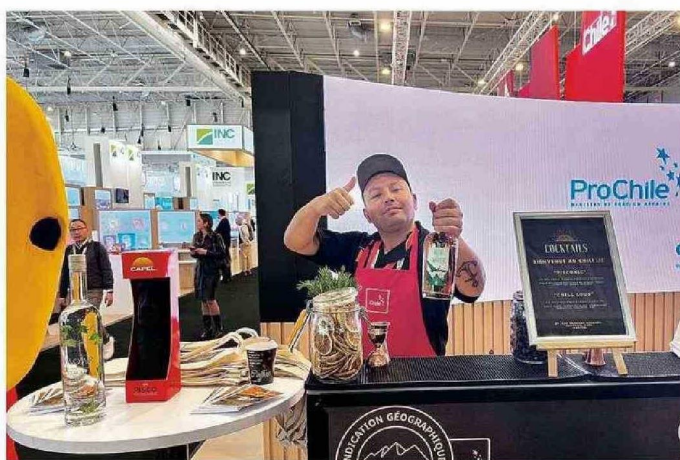
EN EL STAND DE CHILE EN LA FERIA SEAL REALIZADA EN PARÍS.

-Primero estudié en el Intelectur de Santiago y no me gustó porque nunca había lavado ni un plato, era súper regalón y tuve profesores que eran muy exigentes, tenía que limpiar las campanas con escobillita de uñas, después de eso me fui a vivir a Brasil, hice un bar con un amigo, quebró por desorden. Siempre cuento que me echaron de Brasil por desordenado. Lo que pasa es que hice una fiesta de samba en un barrio residencial y se llenó tanto que los autos no pasaban, quedó la grande. Ahí desistí de ese bar y como hablaba portugués me quedé y estudié adminis-