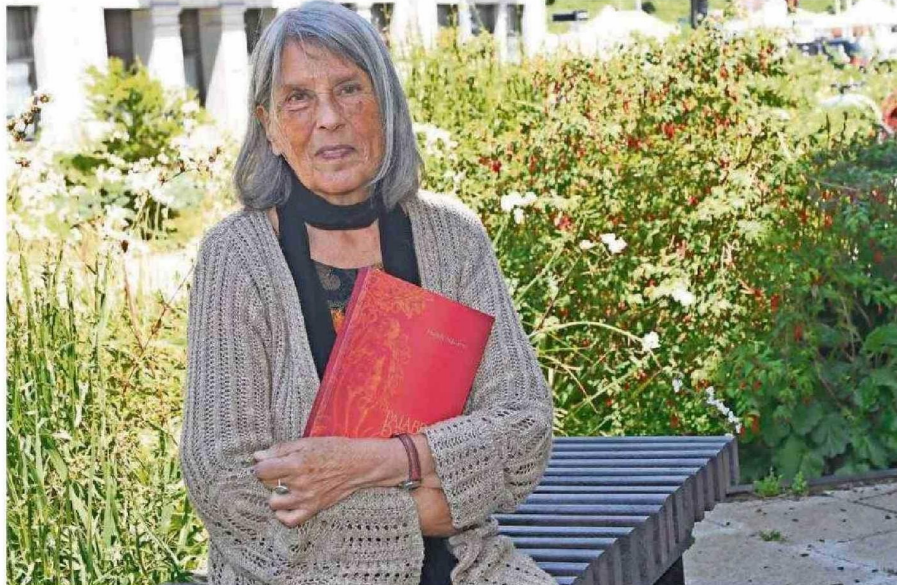
LA INTEGRANTE DEL COLECTIVO LOCAS MUJERES TAMBIÉN FUE MIEMBRO DEL DIRECTORIO DE LA SOCIEDAD DE ESCRITORES DE CHILE.

El año pasado la Fundación Plagio abrió las postulaciones para un premio sobre el impacto creativo de artistas nacionales vivos, específicamente de aquellos ligados a las artes visuales y la literatura. La invitación fue a que la comunidad en