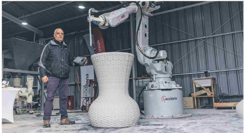
El brazo de impresión 3D de ACCIONA está trabajando en la construcción de un prototipo de vivienda social. Ahora, a modo de prueba, están imprimiendo figuras aleatorias.

¿Qué pasaría si un día pudiéramos levantar una vivienda con sólo tres operarios? Eso podría ser posible gracias a la impresión 3D, dice Verónica Arcos.