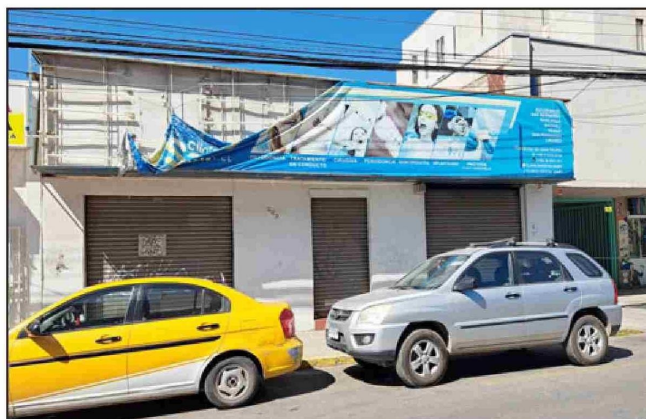
Así luce actualmente la Clínica Dental Samy. Los números de contacto en el cartel no corresponden a la empresa; el celular no responde y el teléfono fijo es de un centro de radiografías.