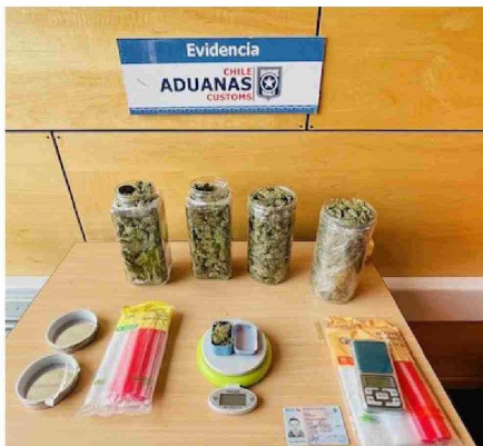
El procedimiento iniciado por Aduanas fue entregado posteriormente a Carabineros.