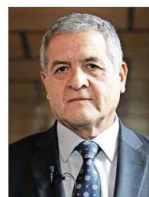
Carroza llegó al máximo tribunal en 2020.

Es un magistrado de carrera judicial, asumió como supremo a fines de 2020, e integra hoy la Tercera Sala.