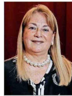
La ministra Vivanco integra la Tercera Sala.

Llegó como "abogado extraño" al máximo tribunal, en 2018 —propuesta por el presidente Piñera—, es decir, no era de carrera judicial. Hoy integra la Tercera Sala.