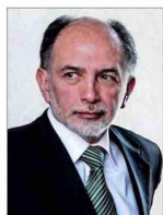
El ministro Muñoz llegó en 2005 al máximo tribunal.

Sergio Muñoz, quien preside la Tercera Sala, llegó al máximo tribunal en 2005, tras ser nombrado por el expresidente Lagos. Como ministro en visita indagó los casos Riggs y Spiniak.