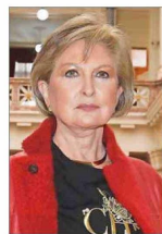
Letelier integra la Sala Penal de la Suprema.

Llegó al máximo tribunal en 2021 —propuesta por el fallecido presidente Sebastián Piñera y con la ratificación unánime del Senado—, tras ser ministra de la Corte de Apelaciones de San Miguel. Ese año estuvo entre quienes votaron en la sala por acoger amparos de inmigrantes, incluso con condenas y causas penales en sus países. En 2004 fue ministro en visita por el bombarzo que destruyó el frontis del BancoEstado en Gran Avenida.