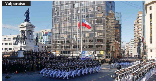
El Presidente Boric retorna a la Plaza Sotomayor. El acto contó con la presencia del jefe de Estado, quien el año pasado concurrió a la ceremonia en Iquique. El mandatario se arrodilló y dejó una rosa blanca frente a los restos de Arturo Prat.

Incorporará un rompehielos, un patrullero y un remolcador: La Armada alista tres nuevas naves para potenciar el desarrollo del territorio antártico chileno