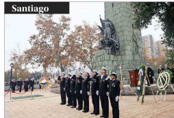
Personal de la Armada y reservistas desfilaron y rindieron honores a los héroes de Iquique y Punta Grieta.