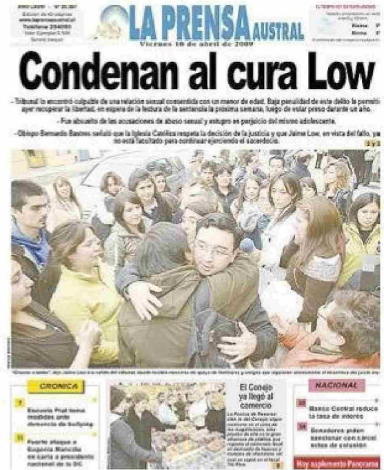
La portada de La Prensa Austral del 10 de abril de 2009 que informó sobre la condena que recayó sobre el otrora sacerdote.