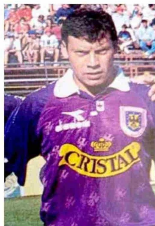
Con la camiseta de Deportes Concepción.

desde su época de futbolista y que con el paso de los años se estaba complicando. Junto con desearle una recuperación favorable le agradecemos la distinción y cordialidad con la cual siempre nos ha distinguido y por haber adoptado en su momento la sabia determinación de declararse hijo adoptivo de Talca, ya que su presencia no pasa desapercibida y es un ejemplo frente a los egoísmos que de vez en cuando suelen aparecer en el acelerado escenario de la vida.