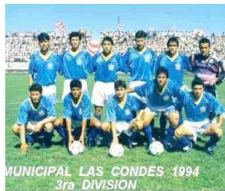
Municipal Las Condes 1994.