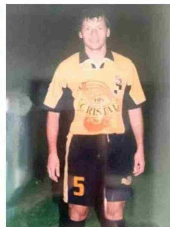
En su temporada en el equipo de Coquimbo Unido.