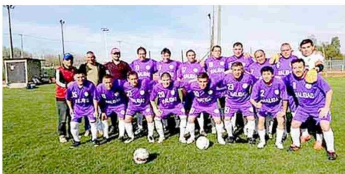
Su presente con el equipo de futbol de la Dirección de Vialidad del Ministerio de Obras Públicas.