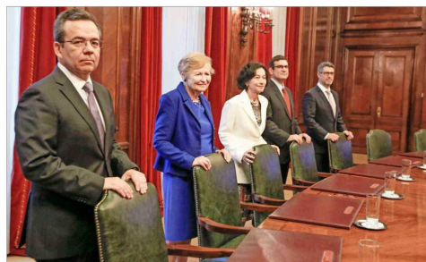
El Consejo del Banco Central decidió por unanimidad dejar sin cambios la TPM en 5,0%.

"Mi lectura es que el Banco Central (BC) no va a retomar el proceso de recorte de tasas e incluso los parámetros fundamentales sugieren que la tasa rectora de 5% sigue siendo contractiva y superará el nivel neutral de 4% — mientras no vea que haya un escenario claro de que la inflación va descendiendo", dice Lehmann. Su visión es que hacia el segundo semestre, probablemente hacia fines del tercer trimestre, cuando los fac-