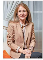
Actual vicepresidenta asumirá el 17 de diciembre hasta 2026.