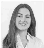
Por Soledad Monge Economista Libertad y Desarrollo