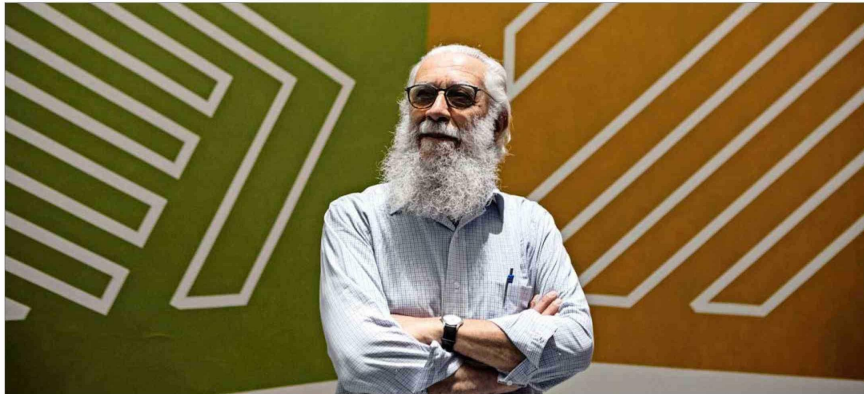
"En Valparaíso dibujábamos mucho en los cerros. Una de las características es que hay pocas líneas horizontales, o se pierden. Esa diagonal está muy presente en mi obra. La hice mucho, pero luego uno se fatiga con la diagonal. Y me pasé al rectangular", dice Rivera-Scott.