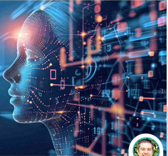
IMAGEN GENERADA CON INTELIGENCIA ARTIFICIAL