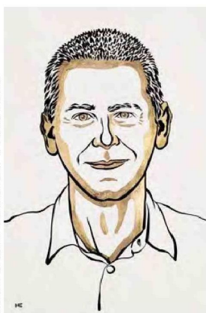
DERECHOS DE AUTOR. ILUSTRACIONES: © NIKLAS ELMHEID