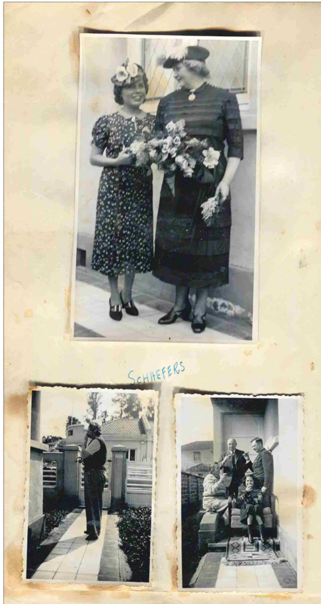
La vida cotidiana, los paseos y los grandes acontecimientos de una familia contiene el álbum.