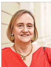
Leonor Etcheberry Court.