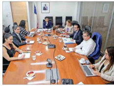
Por casi dos horas sesionó la instancia, compuesta por seis autoridades que sustituyeron a los titulares.

"Subrogantes" de ministros Comité del Gobierno vota nuevamente en contra de Dominga: uno de sus integrantes ya se había opuesto al proyecto minero