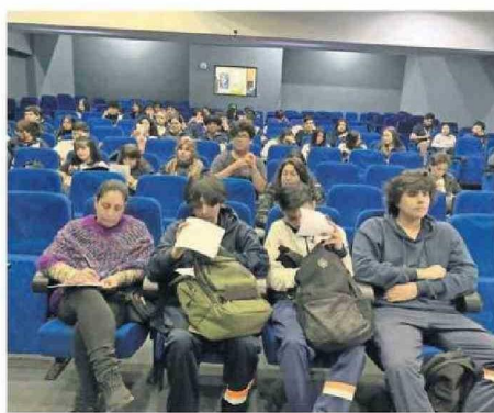
REALIZARON CHARLAS A LOS ESTUDIANTES DE LA REGIÓN.

Con esto, en Antofagasta la Seremi de Educación ha realizado varias actividades de difusión para que los estudiantes que ingresarán a la educación superior en el 2025, puedan acceder sin problemas a los beneficios.