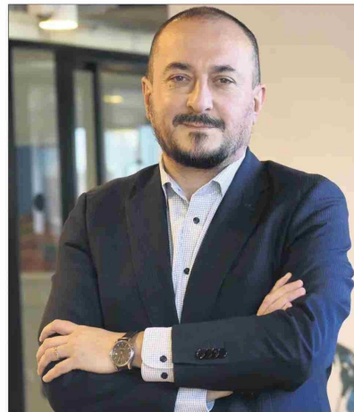
Ricardo Pizarro, defensor nacional del Contribuyente.