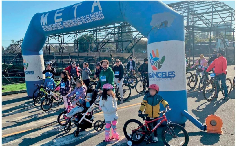
EN SU PRIMERA VERSIÓN la rodada de salud familiar convocó a decenas de participantes.

Según explicaron los profesionales, esta actividad consiste en realizar una ruta recreativa en cualquier vehículo con ruedas, sin motor, es decir, a tracción humana, como bicicletas, scooter, skate, sillas de ruedas, coches de bebé. “La idea es que este recorrido sea lo más inclusivo posible pues la actividad física es muy importante para todos y todas”, apuntaron.