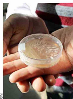
El trabajo con bacterias se ha realizado durante varios años.

una pista de que probablemente está muy adaptada al medio marino, porque el mar es ligeramente alcalino".