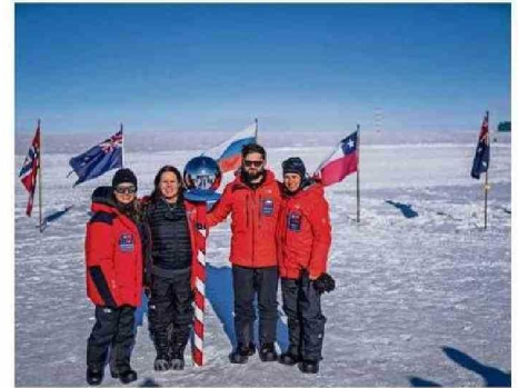
BORIC Y SU COMITIVA EN LA EXPEDICIÓN “ESTRELLA POLAR III”.