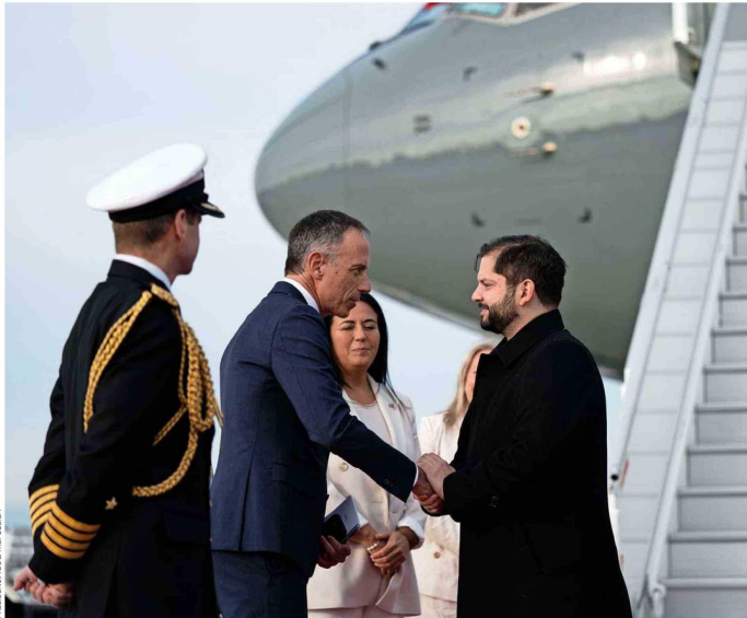
Visita del Presidente Gabriel Boric a Canadá.