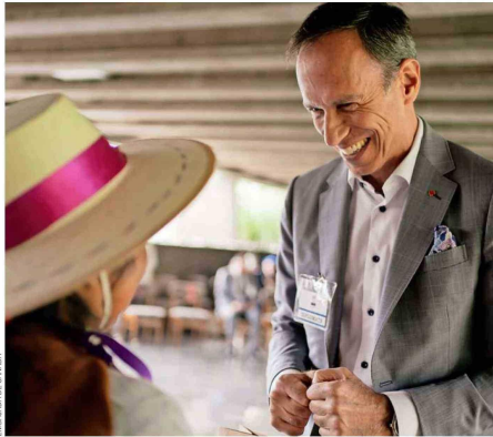
Con una de las beneficiarias del programa Originarias de ONU Mujeres y Teck.