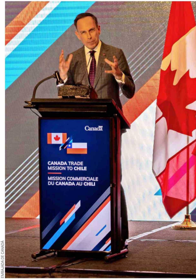
Dando un discurso durante la visita a Chile de la ministra de Comercio canadiense Mary Ng.