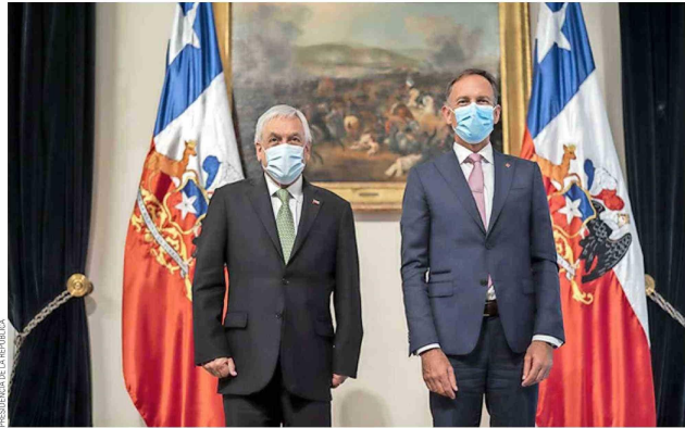
Con el Presidente Sebastián Piñera a poco de llegar a Chile.