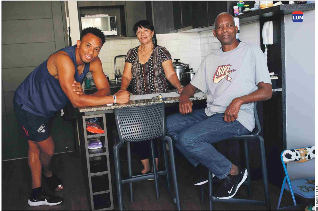
Ford está feliz y ahora vive en el mismo condominio junto a toda su familia.

El campeón del decatión Santiago 2023 se recupera de una cirugía junto a sus progenitores que dejaron Cuba para residir en Chile.