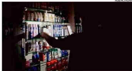
La emergencia no quedó resuelta anoche.

Nada más declararse la emergencia, el presidente de la República, Gabriel Boric, se desplazó a la Central de Gestión Operativa de Carabineros de Chile para monitorear la emergencia y luego sobrevoló en un helicóptero la capital, donde vive casi la mitad