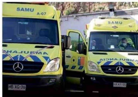
EL AUMENTO DE AMBULANCIAS NO RESUELVE EL PROBLEMA.

ayer (viernes) se había pedido un aumento de dotación de ambulancias (para el fin de semana) por si se necesitaba hacer el traslado de los niños al no haber confirmado a un médico. Hoy día el hospital tiene un médico que solamente está sacando lo más urgente porque definitivamente un médico no puede hacer mucho para atender todo lo que requiere Pediatría.