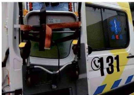
SE PIDIÓ UNA AMBULANCIA EXTRA PARA URGENCIAS PEDIÁTRICAS.

La falta de especialistas en el Claudio Vicuña generó preocupación, con solo un médico disponible para cubrir urgencias y hospitalización infantil.