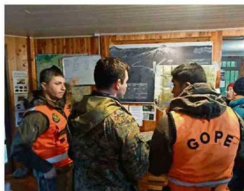
UN PUESTO DE TRABAJO SE INSTALÓ EN DEPENDENCIAS DE CONAF EN EL PARQUE NACIONAL VILLARRICA.

Con estos antecedentes y la georreferenciación telefónica, las patrullas establecieron un plan de búsqueda in-