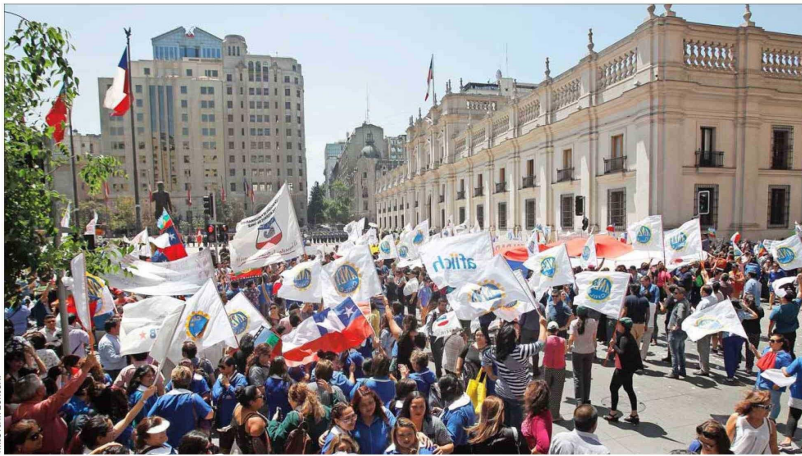
Los empleados públicos esperan negociar con el Gobierno en la discusión del reajuste del sector público, la determinación de plazos por ley para la confianza legítima en las contrata.

A fines de 2014 llegaban a 144.449 y a junio de este año casi se han duplicado a 274.350. Más de la mitad de estos empleados a plazo fijo se concentra en el sector salud. Expertos urgen por reforma al régimen del trabajo público.