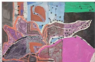
Flor, técnica mixta, 1954, Alberto Cruz. El color y la abstracción sobresalen