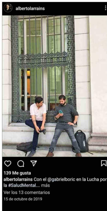
Larraín tenía nexos con Boric desde sus tiempos de diputado.

A una semana de esas declaraciones, se activaron las diligencias en un caso que había