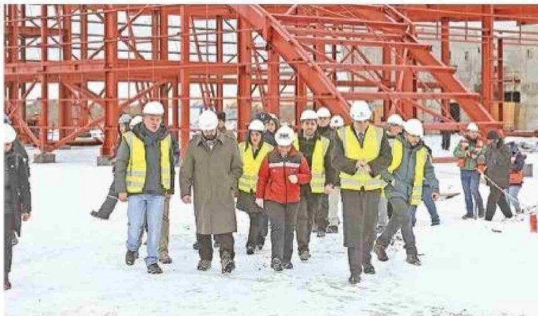
El Presidente Boric en su última visita a Magallanes ordenó acelerar la remodelación del aeropuerto de Punta Arenas .

El proyecto de mayor inversión registrado en la plataforma corresponde a “Don Julio”, del titular Generación Sustentable Tierra del Fuego SpA, con un estimado de $20 mil millones de dólares