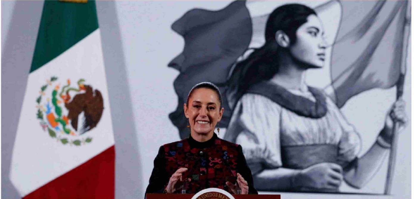
► La Presidenta de México, Claudia Sheinbaum, habla durante una conferencia de prensa en el Palacio Nacional, en Ciudad de México, México, el 8 de enero de 2025.