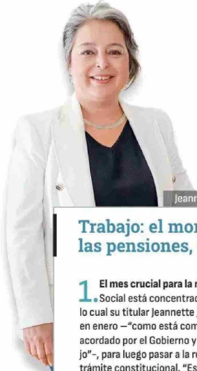
Jeannette Jara, ministra del Trabajo y Previsión Social.