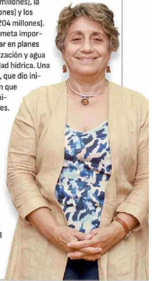
Jessica López, ministra de Obras Públicas.

3. Asociación público-privada. Este año la Dirección General de Concesiones "seguirá acelerando licitaciones de nuestra cartera de proyectos". En línea con el resurgimiento del sistema de concesiones en los últimos dos años, el MOP seguirá impulsando durante el presente ejercicio su cartera de proyectos 2024-2028, que incluye 43 contratos. De ellos, 26 corresponden a iniciativas en las áreas de transporte y edificación públicas, 13 a carreteras, dos a aeropuertos e igual número a infraestructura hídrica.