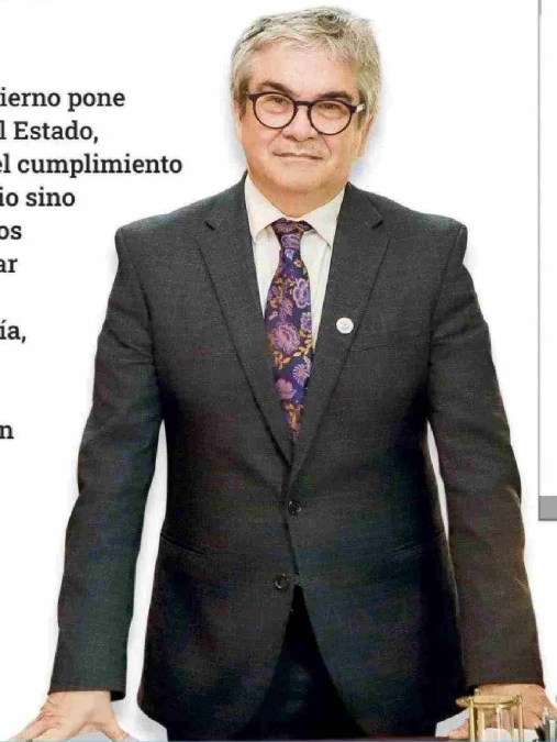
Mario Marcel, ministro de Hacienda

El inicio del último año de Gobierno pone presión a toda la estructura del Estado, obligando no sólo a extremar el cumplimiento de los planes de cada ministerio sino también a priorizar los objetivos principales que busca concretar la actual administración. Las carteras de Hacienda, Economía, Minería, Obras Públicas, Trabajo y Transportes y Telecomunicaciones definieron sus metas para la recta final.